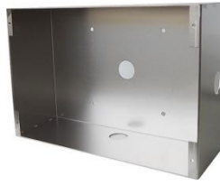
埋込ボックス外形寸法図