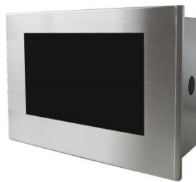
10インチ液晶ワイドビデオモニタ NM-LCDW101S-ATC 専用